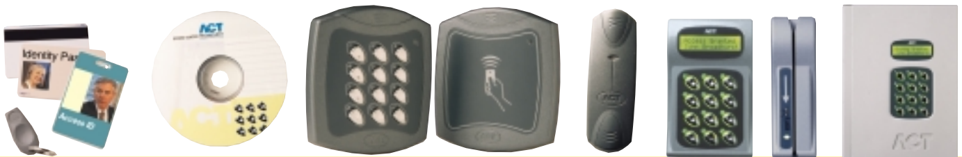
Tarjetas ACT y Fobs

Especificaciones del PC: El software ACTWin requiere Windows 9X o Windows NT-XP.